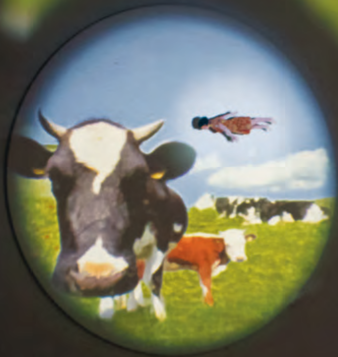
Manon Labrecque, Les traversées , 2012, bois, aluminium, ressorts, flûte, moteurs, ventilateurs, lampe halogène, lentilles, anneau de plexiglas et impression au jet d'encre sur pellicule transparente, cercle en bois peint (écran) et circuits électroniques, 153 cm (diamètre de la pellicule transparente), 165 cm (diamètre de l'écran). Achat grâce à l'appui du Conseil des arts du Canada dans le cadre de son programme d'aide aux acquisitions (2013.44).