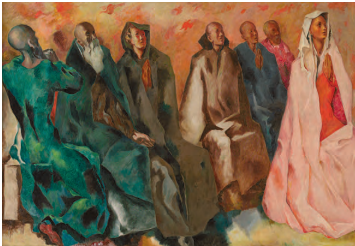
Père Marie-Alain Couturier, La Pentecôte , 1944, huile sur toile, 137,5 × 363 cm. Don de la Corporation des Dominicains de la cité de Québec. Restauration effectuée par le Centre de conservation du Québec grâce à la contribution du Conseil du patrimoine religieux du Québec (2013.48).