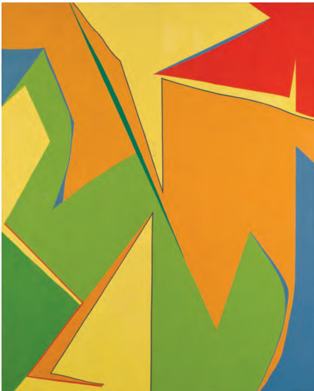
Fernand Leduc, Jaune , 1962, huile sur toile, 162,4 × 129,8 cm. Don de l'artiste (2013.378).