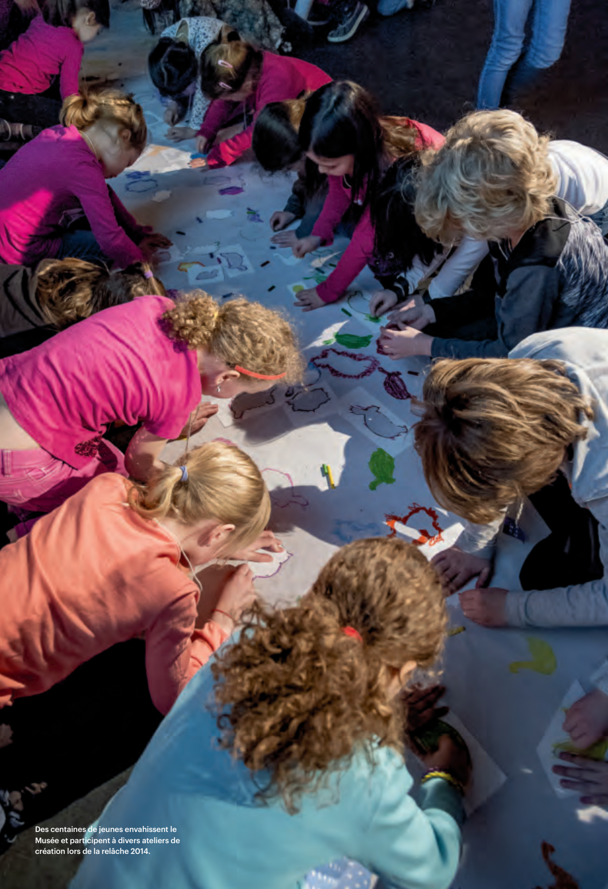
Des centaines de jeunes envahissent le Musée et participent à divers ateliers de création lors de la relâche 2014.